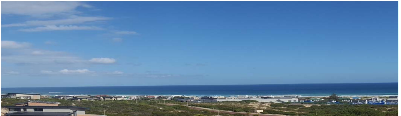
Die eindlose see-uitsig vanuit Stilbaai Duine

Ons het 'n skrywe aan alle Eiendomsagente in Stilbaai gestuur om hulle weer in te lig dat enige Eiendomsagent eiendom in Stilbaai Duine mag verkoop en dat daar geen eksklusiewe mandaat met Stilbaai Duine Eiendomme bestaan vir die verkoop van eiendomme in Stilbaai Duine nie. Stilbaai Duine se webwerf is ook aangepas om hieraan te voldoen.