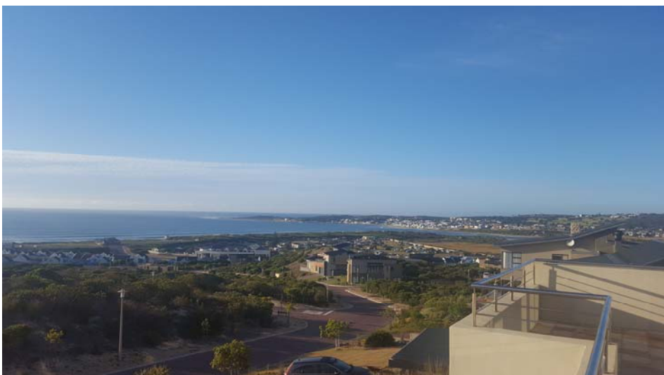
Stilbaai Duine se see-uitsig